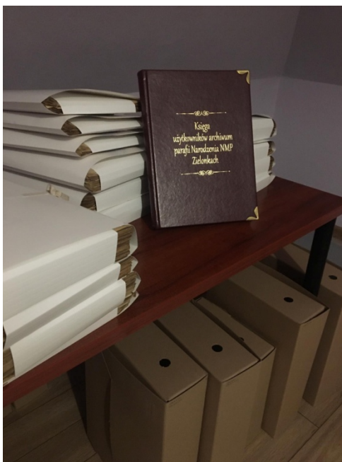
Zdjęcie 8. Księga ewidencji użytkowników uporządkowanego archiwum parafialnego na tle uporządkowanych dokumentów.

Na samym końcu pudła z materiałami archiwalnymi zostały ułożone w szafach i nadano im numery topograficzne umożliwiające szybsze odnalezienie. Pomocą w odnajdywaniu potrzebnych jednostek są specjalne naklejki na pudłach i teczkach, a także opracowany (za pomocą ZoSI) inwentarz archiwalny.