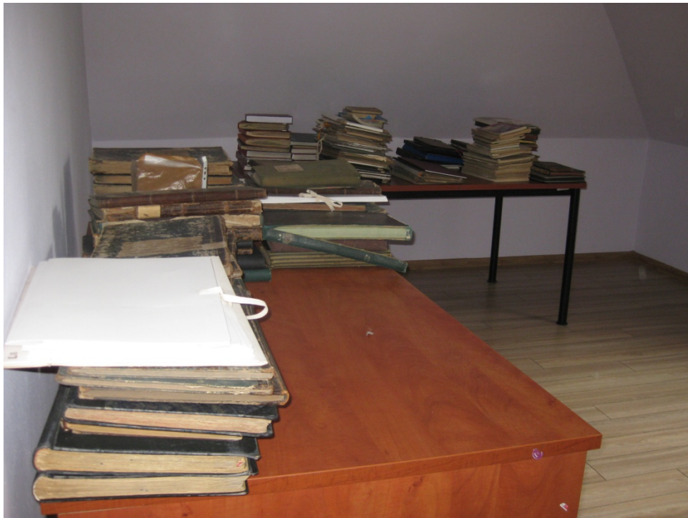
Zdjęcie 3. Początek pracy nad inventaryzacją w osobnym pokoju na plebanii. Początek lipca 2021 r.