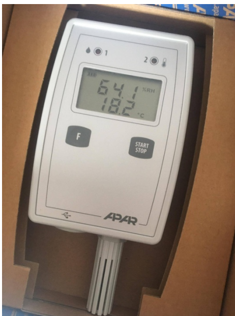
Zdjęcie 7. Zakupiony w ramach projektu termohigrometr.