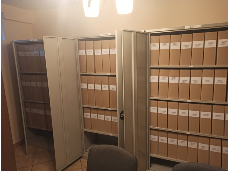
Zdjęcie 11. Nowy wygląd archiwum parafialnego w Zielonkach. Styczeń 2022 r.