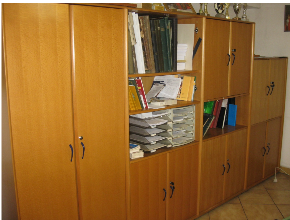
Zdjęcie 1. Archiwum parafialne w Zielonkach w czerwcu 2021 r.

Udało się zrealizować wszystkie zamierzone działania, które pokrótce tu przedstawimy. Po podpisaniu niezbędnych umów przystąpiono do utworzenia na naszej plebanii pracowni archiwistycznej, którą zlokalizowano w dawnym pokoju ks. kanonika Strączka. Przeniesiono tam wszystkie dokumenty archiwalne z kancelarii parafialnej. Przez dokumenty archiwalne należy rozumieć wszystkie te, które znajdowały się w kancelarii, a które nie są wykorzystywane do prowadzenia bieżącej działalności kancelarii.