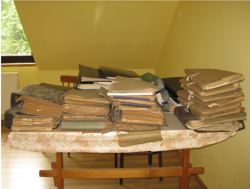
Zdjęcie 4. Protokoły przedślubne przed inwentaryzacją w pracowni. Początek lipca 2021 r.

Zatrudniona archiwistka uporządkowała cały zasób archiwalny poprzez wydzielenie materiałów archiwalnych przeznaczonych do wieczystego przechowywania, dzieląc cały zasób dokumentacji na poszczególne serie tematyczne. Jednostki otrzymały swoje sygnatury, które pozwalają na sytuowanie dokumentów w konkretnym, niezmiennym miejscu. Parafia podpisała umowę, w której zgodzono się na wejście w ogólnopolski Zintegrowany System Informacji Archiwalnej (ZoSIA). Dzięki temu wiedza o tym, jakie dokumenty znajdują się u nas w parafii, będzie powszechnie dostępna dla wszystkich zainteresowanych na stronie szukajwarchiwach.gov.pl . Każda jednostka została zabezpieczona za pomocą teczek i pudeł wykonanych z materiałów bezkwasowych.