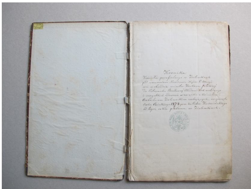
Zdjęcie 5. Strona tytułowa kroniki parafialnej przed konserwacją.