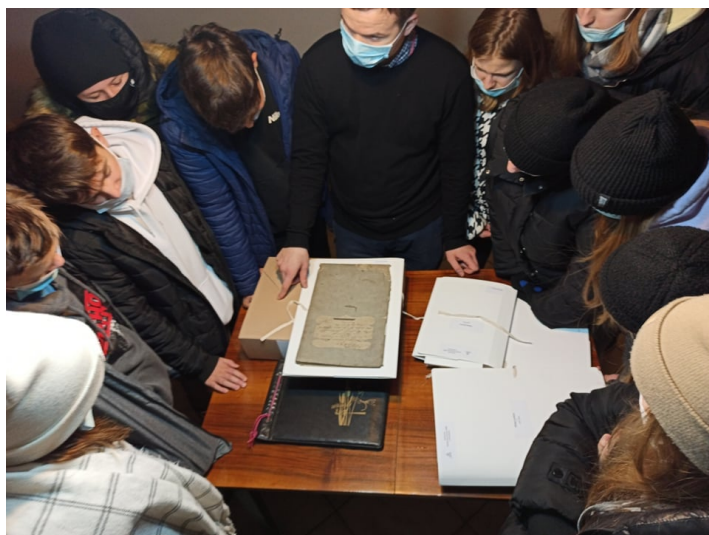
Zdjęcie 10. Lekcja archiwalna dla młodzieży z klasy VIII. 9 grudnia 2021 r.

Oprócz samych prac istotne dla nas było upowszechnianie wiedzy o funkcjonowaniu kościelnego archiwum oraz samej parafii Zielonki. Umożliwiły to: lekcje przeprowadzane w klasach ósmych, publikowanie informacji o przebiegu działań projektowych w Internecie oraz powstały artykuł omawiający dzieje i zasób naszego archiwum parafialnego.