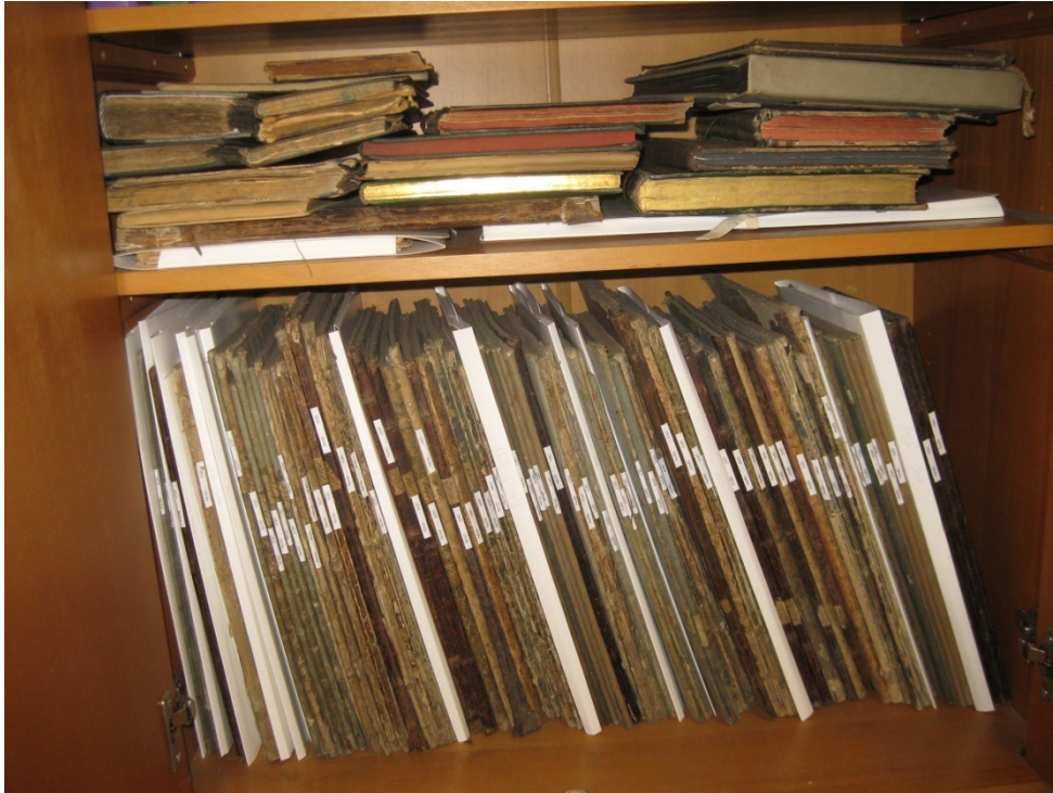
Zdjęcie 2. Nieuporządkowane dokumenty w archiwum parafialnym. Czerwiec 2021 r.