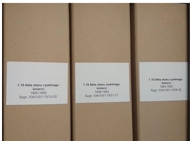
Zdjęcie 9. Zbliżenie na opis pudeł archiwalnych ułożonych w szafach.

Oprócz samych prac istotne dla nas było upowszechnianie wiedzy o funkcjonowaniu kościelnego archiwum oraz samej parafii Zielonki. Umożliwiły to: lekcje przeprowadzane w klasach ósmych, publikowanie informacji o przebiegu działań projektowych w Internecie oraz powstały artykuł omawiający dzieje i zasób naszego archiwum parafialnego.